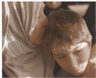
© 2010 Human Film, Iraq Al-Rafidain, UK Film Council, CRM-114ura film

2010年/イラク・イギリス・フランス・オランダ・パレスチナ・UAE・エジプト/90分 監督:モハメド・アルダラジ 出演:ヤッセル・タリブ、 シャーザード・フセイン、 バシール・アルマジド 配給:トランスフォーマー