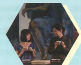
野のなななのか/日本