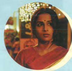
女神は二度微笑む/インド