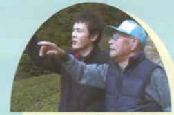
鳥の道を越えて/日本