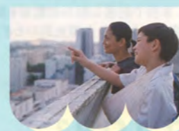
イロイロ ぬくもりの記憶/シンガポール