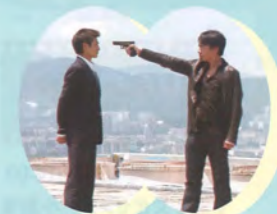
インファナル・アフェア/香港