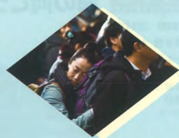
罪の手ざわり/中国