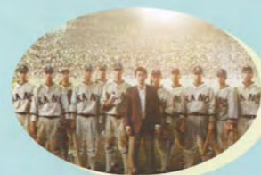
KANO 1931海の向こうの甲子園/台湾