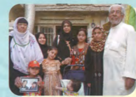
イラク チグリに浮かぶ平和/イラク