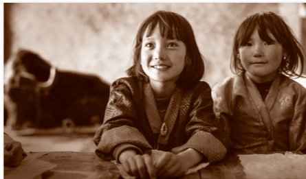
©2019 ALL RIGHTS RESERVED