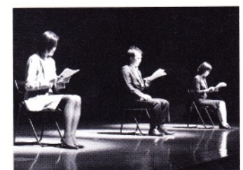
講座第8回目の最終回は、受講者有志の出演による「ドラマリーディング」。