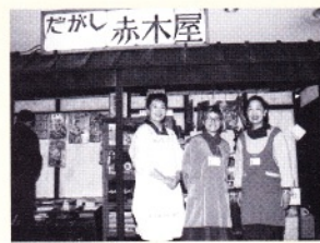
ああ昭和のにおい!!看板娘がお出迎え。