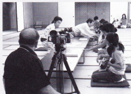
平成18年8月に行われた伝統文化体験教室を記録撮影中のG-free映像スタッフ