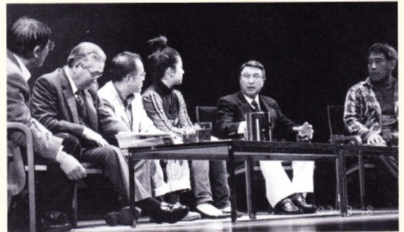
市民スタッフ「G-free」独自企画の第2弾。ひたすら岐阜にこだわり、他にはないものを創ろうとゼロから企画。今回は懐かしの映画と演劇的トーク。