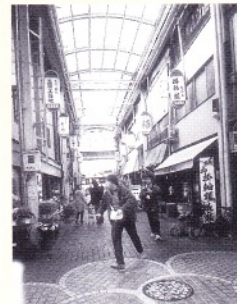
柳ヶ瀬では現地取材の他、演劇的トーク用の映像撮影も。