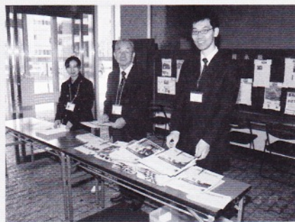
劇場の顔!明るくお客様に対応するG-free表方スタッフ