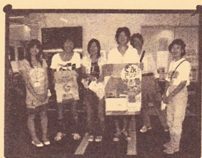
岐阜大学地域科学部の学生さん達と ポスター貼りへ！