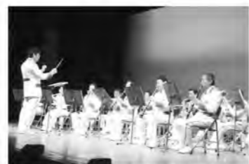
岐阜市消防音楽隊によるオープニング演奏