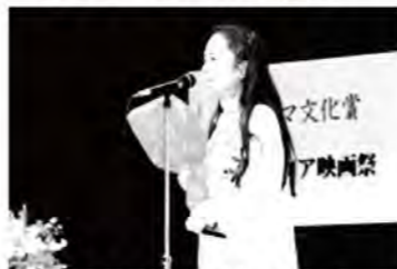
受賞式での平井委員長