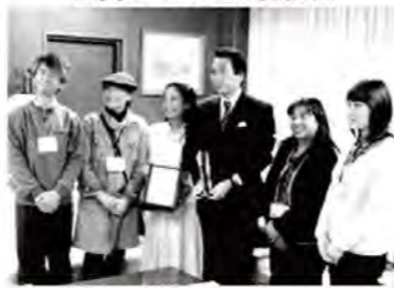
市長への受賞報告