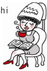
キャラメル ・・・レバノン・・・