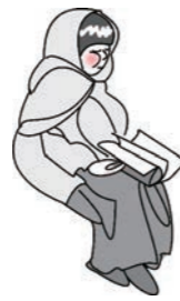
子供の情景 ・・・イラン・・・