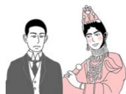
花の生涯～梅蘭芳～ ・・・中国・・・