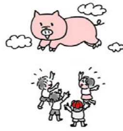
ブタのいた教室 ・・・日本・・・