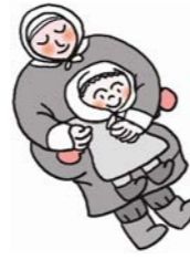
トゥヤアの結婚 ・・・中国・・・