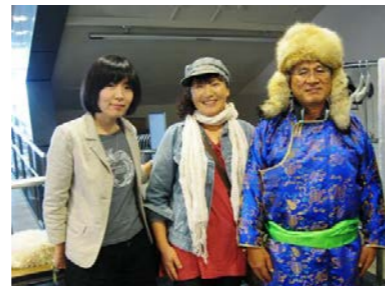
「トゥヤアの結婚」の舞台である モンゴルの衣服を展示しました！！