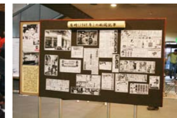
当時の楽譜やレコード、ポスターや新聞を展示しました。 湯川秀樹氏が、日本人初のノーベル賞受した新聞記事が！！