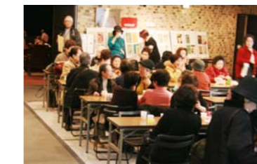
市民スタッフ企画名物 コーヒー販売も好評！！ 「映画上映時をイメージした特別ブレンド」を販売しました。