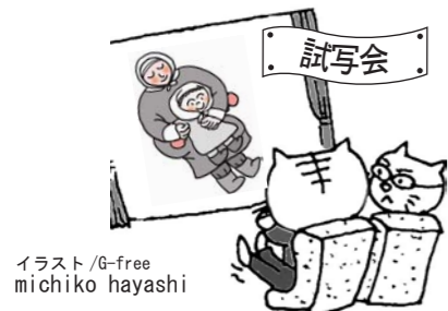
イラスト/G-free michiko hayashi

全体のつりあい・上映時期・お客様の好みや、規制の有無・フィルム代など選考の要素も様々。それでもやはり「これは素晴らしい！ぜひみんなに観せたい！」そんな思いを最終的なスパイスに、思案し発見を重ねつつ、今年も作品選定は進んでおります。さあ、今年はどうなラインナップになるのでしょうか。私自身、とっても楽しみです。