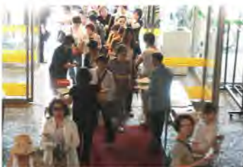
多くのお客様にご来場いただきました。