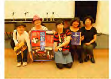
ポスター&チラシを持って行ってきました!!