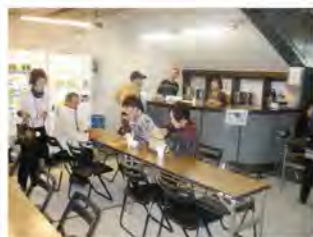
今年も「懐かしのコーヒー」屋さん完売!!