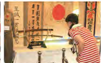
終戦から終戦直後の日本軍や外国軍の資料展示