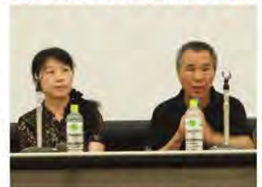
朱天文女史と侯孝賢監督

市民スタッフ 4 人で台湾旅行に出かけた一昨年。そして昨年はその旅行で訪れた場所九ヶ分が舞台の「悲情城市」を映画祭にて上映。今更ながらここ最近、台湾と台湾映画に魅せられていた私たち…。そこにこの 6 月、愛知芸術文化センターに、その悲情城市の監督でもあり世界的巨匠、侯孝賢 (ホウ・シャオシェン) 監督がお見えになると聞き、憧れの監督に会える機会を逃すまいとみなで出掛けました。ホウ監督は本当に素敵な方でした。映画とは人の「存在感」であると語る監督。紡がれる言葉の数々から、侯孝賢映画の魅力のわけが少しわかったような気がしました。また、ご一緒に来日された、作家でもあり脚本等で監督のパートナーの朱天文 (チュウ・ティエンウエン) 女史の知的な美しさにもすっかりファンになりました。監督は我々が持参したポスターにも快くサインをして下さり、2 年前には想像もつかなかった思い出深い一日となりました。 (G-Free: 大江 繁美)