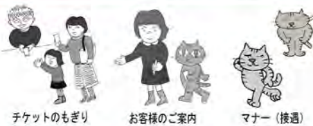
チケットのもぎり お客様のご案内 マナー (接遇)