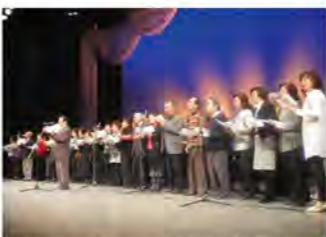
うたごえ広場では、会場と舞台とが一体!!